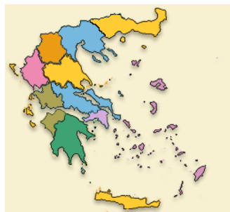
Εικόνα 2.10 Διοικητικές περιφέρειες της Ελλάδας όπου διεξήχθη η μελέτη (2012)